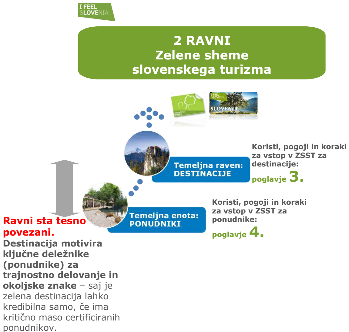
Shema št. 1: Prikaz dveh ravni delovanja ZSST